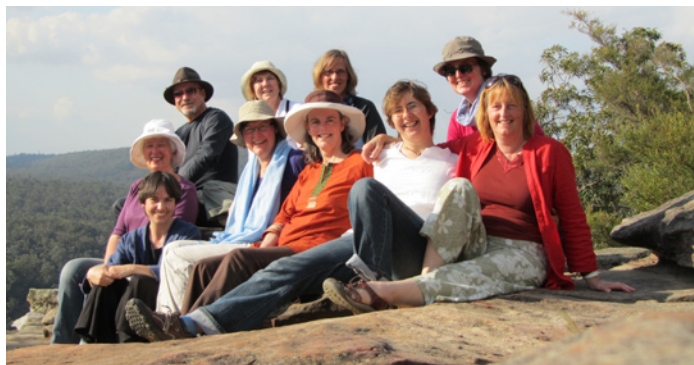
die Teilnehmer/innen der Begegnung am Nepean Fluss in Mulgoa

Bei der Ankunft in Mulgoa in der Nähe von Sydney waren die Teilnehmerinnen und Teilnehmer entzückt vom Anblick der Känguruhs auf der Koppel und der Regenbogenpapageien auf dem Baum vor dem Speisesaal. Die erste Woche verbrachten die Assistentinnen und Assistenten aus Gemeinschaften in Kanada, Deutschland, der Schweiz, Irland, England, Frankreich und Bangladesh damit, mehr über Australien zu lernen: die Natur, die Geschichte, die Sicht auf die Welt vom Südpazifik aus und natürlich die Arche in Australien! Wir hatten auch Zeit, den Berichten der Teilnehmer/innen über sich selbst und ihre Gemeinschaften zuzuhören und verschiedene Gebetsformen kennen zu lernen.