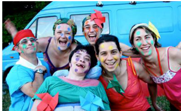
festival Let's be different

„Let's be different!“ („Trau dich, anders zu sein!“) Unter diesem Motto fand im Juli ein fünftägiges Festival für 600 junge Menschen in der Nähe von Paris statt. Der wichtigste Beitrag zu seinem Erfolg war die Zusammenstellung der Teilnehmer: Eine Person mit Behinderung und eine ohne Behinderung bildeten jeweils ein Paar. Einige dieser Paare kannten einander bereits, aber nicht alle.