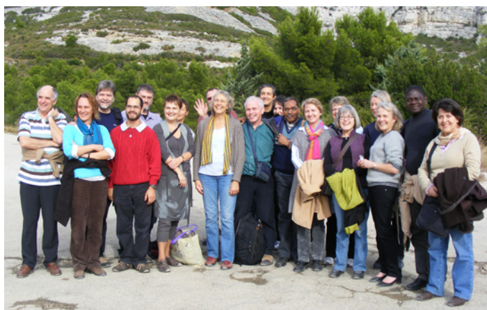
der International Mission Council in Aix-en-Provence